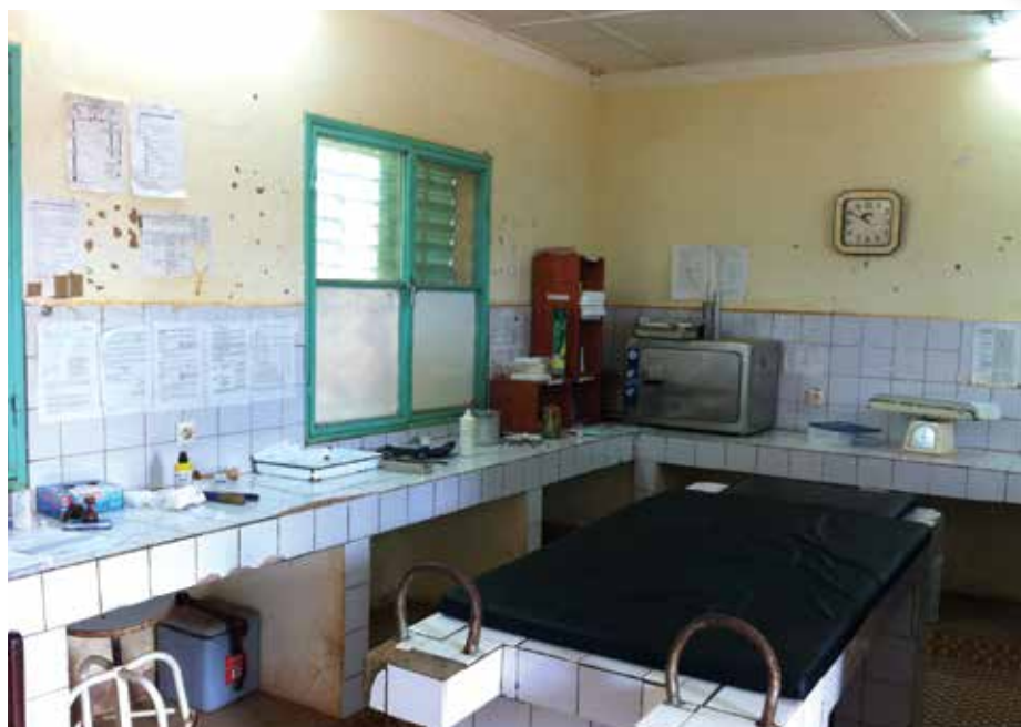
Salle accouchement Orodara Burkina Faso