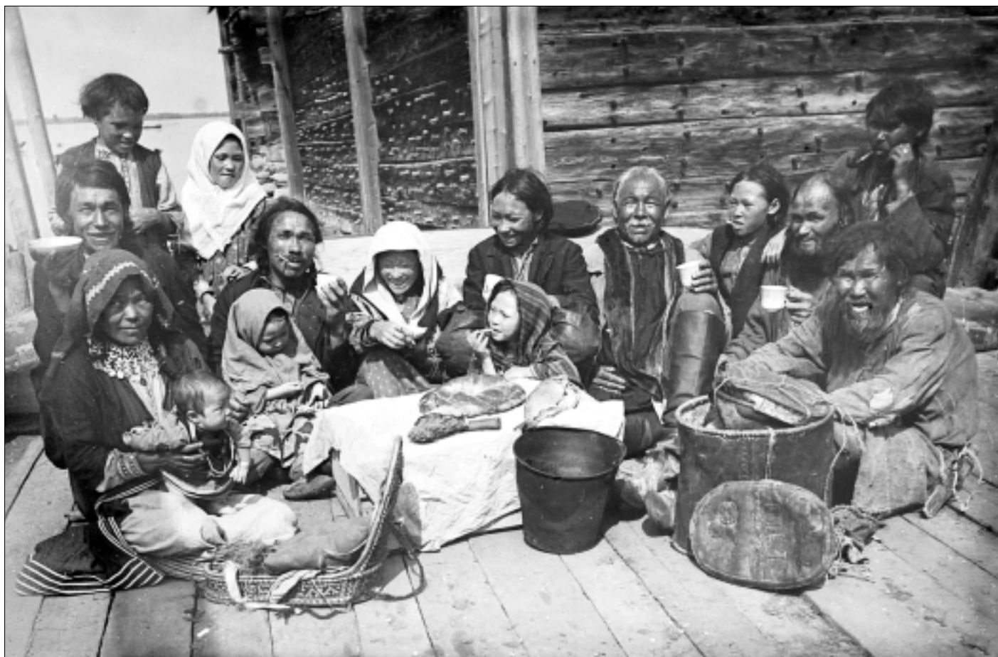
Семья манси на Оби. Фотография сделана участниками переписи.